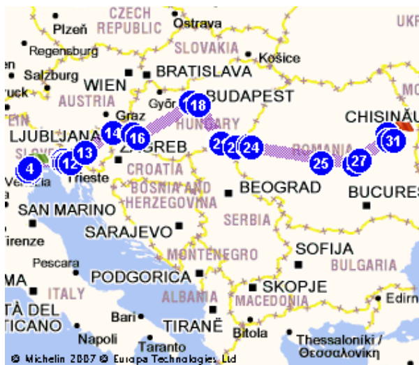
Mapa del viaggio

La Carovana ha l'intento di scoprire le bellezze naturali e culturali della Transilvania e della Moldavia romena, conoscere il popolo Csango, che di quella parte d'Europa è sicuramente una delle componenti più ricche per cultura, arte, storia e tradizioni. Ma non solo. Ci proponiamo infatti anche di portare solidarietà ed aiuto materiale a scuole e associazioni che lavorano con i bambini.